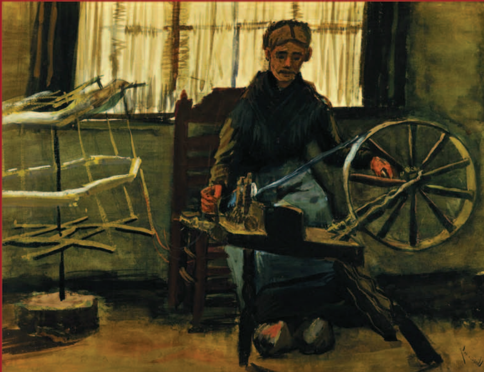
Vincent Van Gogh Donna al filatoio 1884 acquerello su carta vergata New York, Collezione Privata